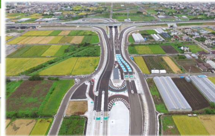
南側から北側を望む