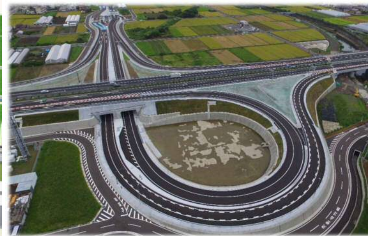
北側から南側を望む