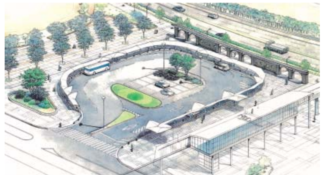
JR清水駅東口駅前広場