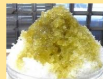
かき氷（夏季限定） 300円