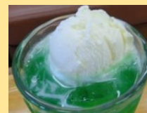
メロンクリームソーダ 350円