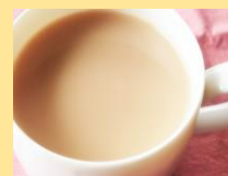
ミルクティー（ホット/アイス） 250円