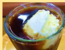
コーヒーフロート 350円