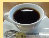
コーヒー（ホット/アイス） 250円