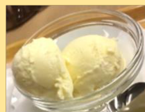
アイスクリーム 150円