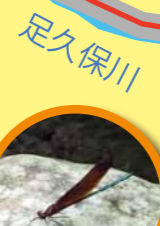
ミヤマカワトンボ