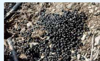
カモシカの糞 (ため糞となる)