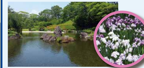
紅葉山庭園池 ハナショウブ

紅葉山庭園は、公園内に設けられた庭園で、四季の風景や茶室でのお茶などが楽しみ、ゆったりとした時間が過ごせます。 入園料: 大人150円、こども50円 開園時間: 午前9時から午後4時30分まで 休園日: 月曜日、年末年始(12/29~1/3)