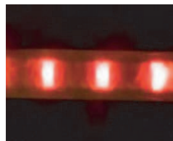
腕などに巻くスイッチタイプ

※自発光式反射材は、市内各警察署にある静岡県交通安全協会やホームセンター、100円ショップなどで取り扱っています。