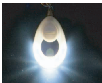
スイッチを入れて光るタイプ