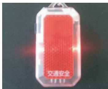
暗がりでは揺れると光るタイプ (光振動センサー付き)