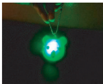
揺れると光るタイプ (振動センサー付き)