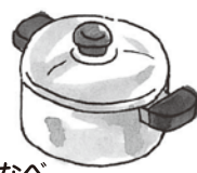
なべ (ホーローも可)