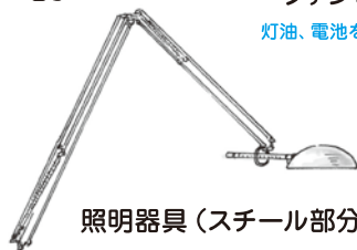
照明器具(スチール部分)