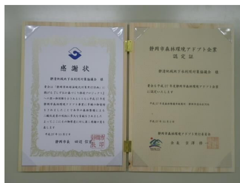
森林環境アドプト企業認定証及び感謝状