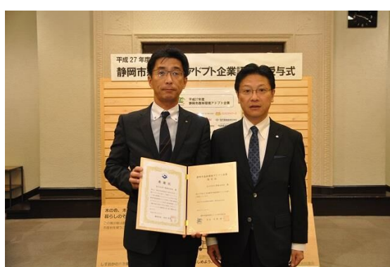
静岡市長と記念撮影