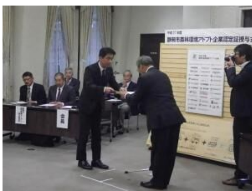
森林環境アドプト企業認定証授与