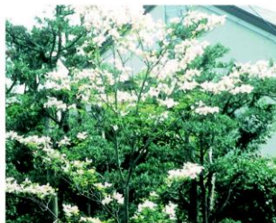
市の木／ハナミズキ

大正時代に東京市長がワシントンに贈ったサクラの返礼として渡来した日米親善の木です。贈ったサクラの苗が清水区興津の果樹研究所で栽培されたものことから、本市にゆかりのある木となっています。春に花を咲かせますが、大きな花びらに見えるのは総苞片で、ピンク色と白色があります。また、秋には紅葉します。