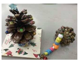
●自然物を使った工作