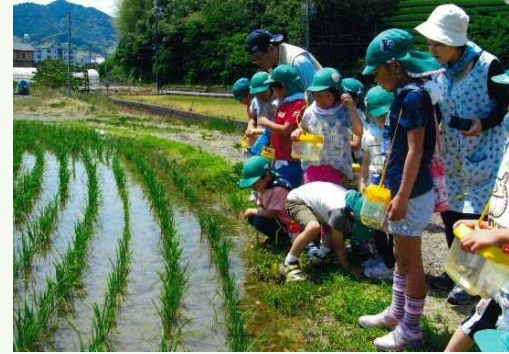
園周辺を散策しながら野草遊び（保育園）