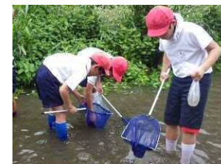
●水のおまわりさん