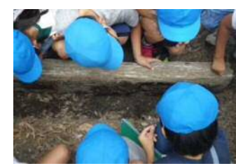
●身近な自然の観察