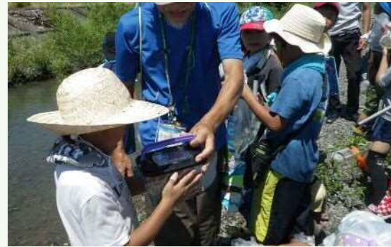
水生生物の観察会（児童クラブ）