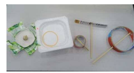
●もったいない工作