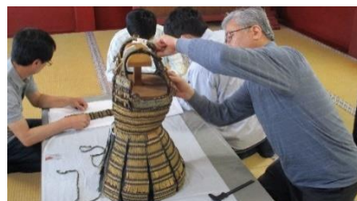
【静岡浅間神社での調査風景】