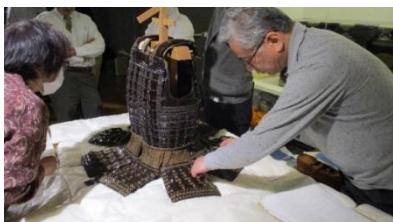
【久能山東照宮での調査風景】