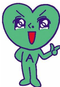
葵区 PR キャラクター あおいくん

5. 備考：中部横断自動車道整備促進静岡県中部地域協議会と 中日本高速道路（株）による啓発活動も同時開催されます。