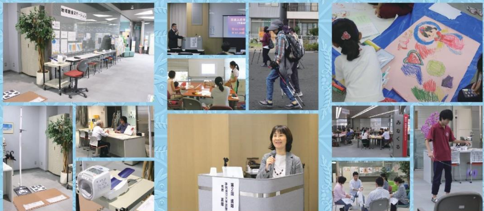
健康の「見える化」や健康情報の発信など 講座・イベントなどで学びの場を提供 地域・多世代の交流や居場所づくりなど

県立大学が担う共生事業の柱 ● 地域健康ステーション ● 地域健康オープンカレッジ ● みなくるカフェ 大学の知を活用した調査・研究活動も進め、その結果を地域に還元し、「共生社会」を地域とともに考えます。