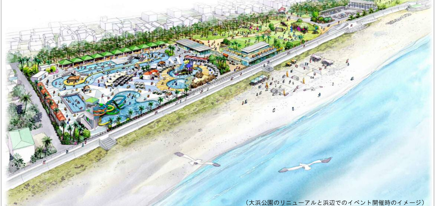
(大浜公園のリニューアルと浜辺でのイベント開催時のイメージ)

公園全体のリニューアルにより、駿河湾と富士山を望む海辺の豊かな環境を活かして新たな地域の賑わいを創出する拠点づくりを目指します。