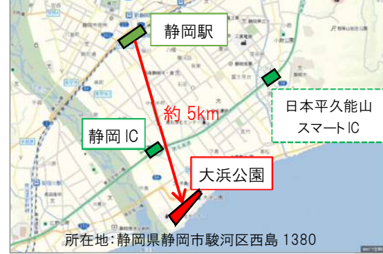
図1) 大浜公園へのアクセス

大浜公園プールは、大浜海水浴場の代替施設として昭和5年に開園した歴史ある公共施設で、無料※で利用できる人気施設として広く市民に愛されてきました。