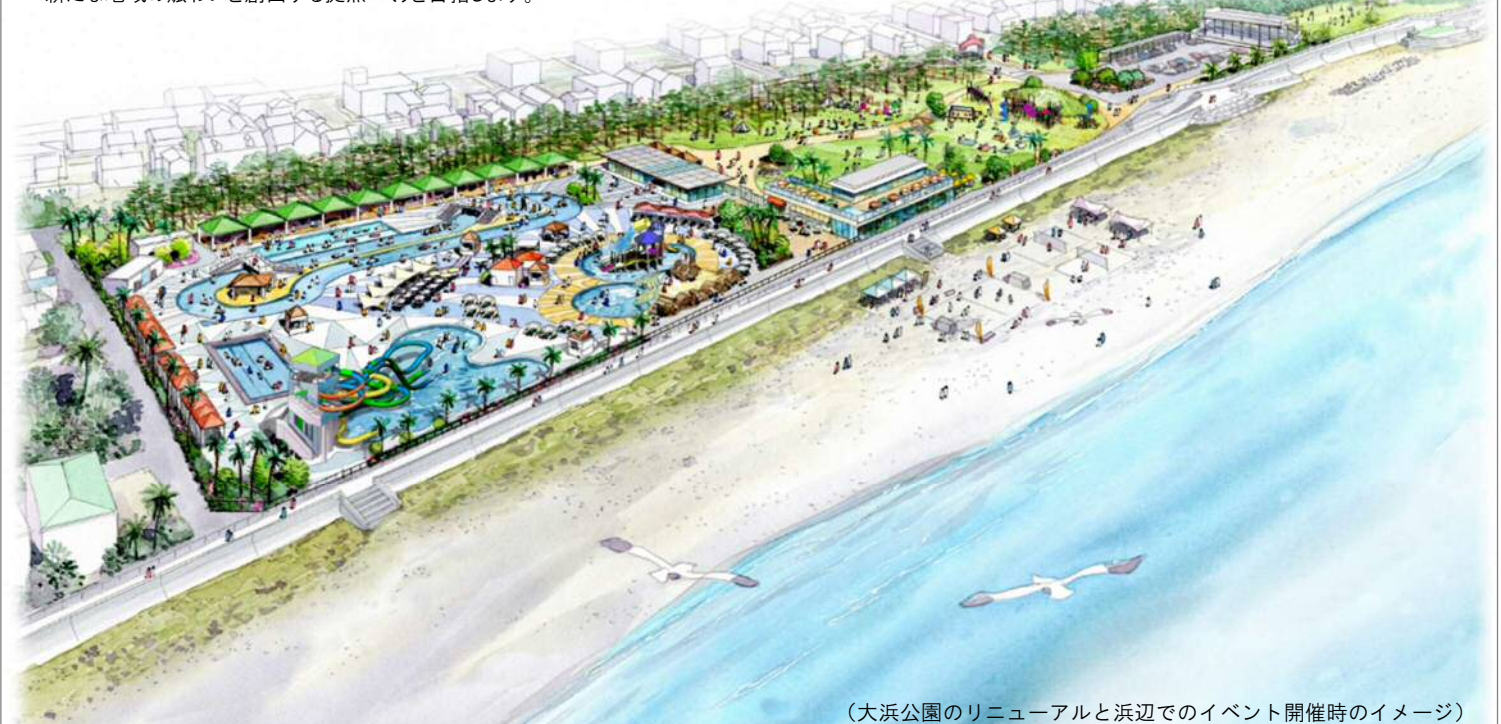
(大浜公園のリニューアルと浜辺でのイベント開催時のイメージ)

公園全体のリニューアルにより、駿河湾と富士山を望む海辺の豊かな環境を活かして新たな地域の賑わいを創出する拠点づくりを目指します。