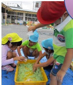
色かんでんむぎゅ！！