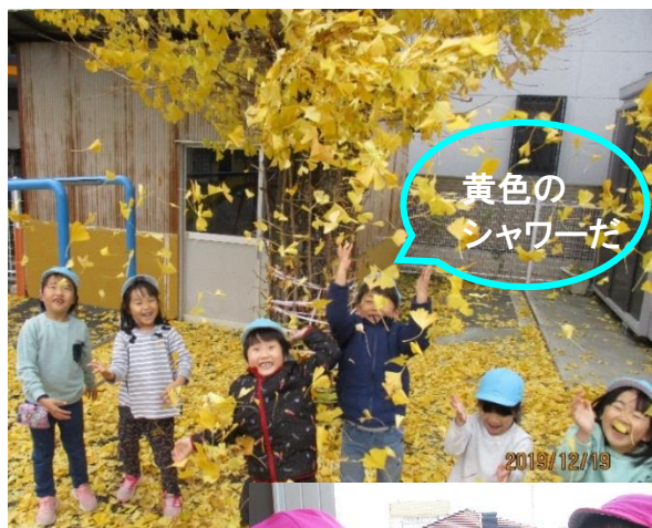
黄色の シャワーだ