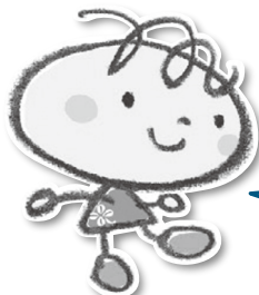
ごみ減量啓発キャラクター しずもちゃん

資源物の出し方や分別については、 「ごみの出し方・分別ガイドブック 保存版」を ご覧ください。