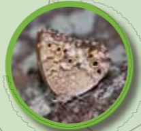
サトキマダラヒカゲ