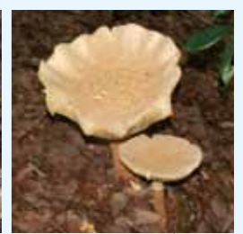
シロオニタケモドキ