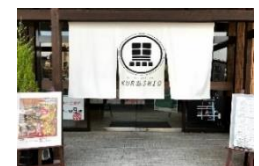
工キチカ温泉くろしお