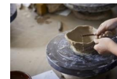
体験型学習プログラム