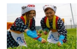
グリンピア牧之原