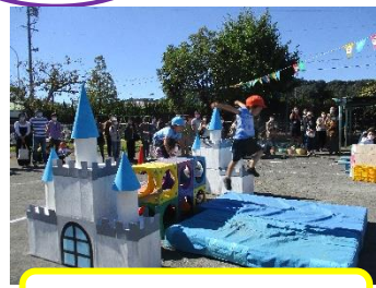
お城からジャンプ！