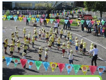
元気いちばんばん