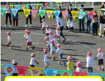
さくらんぼりすみ！

こうやってつなげてみよ うかな？年長の真似っこで、 お風呂マットを使って坂道 づくり…の年少さん！