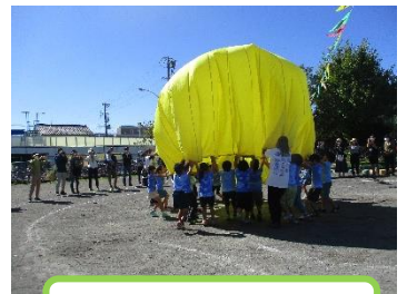
バルーン、ロケット