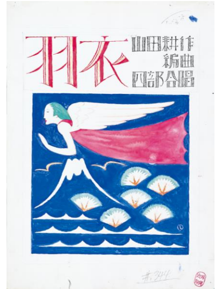
竹久夢二《羽衣(セノオ楽譜原画)》 大正 13 (1924)年頃