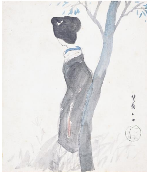
竹久夢二《うしろ姿》 大正中期