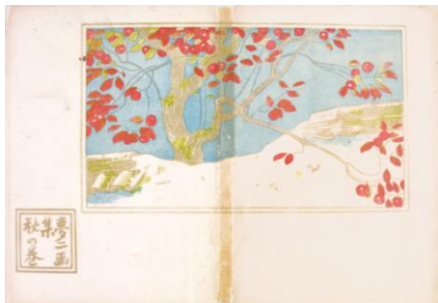
竹久夢二『夢二画集 秋の巻』 明治 43 (1910)年