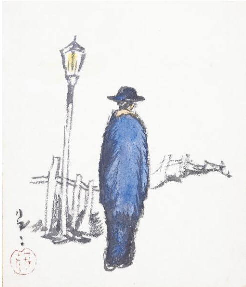
竹久夢二《寒燈》 大正中期

本展では、志田コレクションの中から肉筆画と自筆書簡を含む 30 点あまりを展観します。瑞々しい感性で紡ぎ出された竹久夢二の世界をお楽しみください。