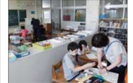
(非常勤講師を配置した自閉症・情緒障害学級の授業風景)