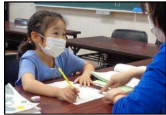
(1年生の日本語指導風景)