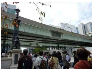
日本橋と首都高速道路