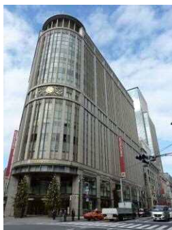
日本橋・三越本店新館