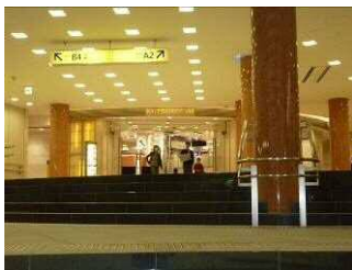
三越本店新館出入口