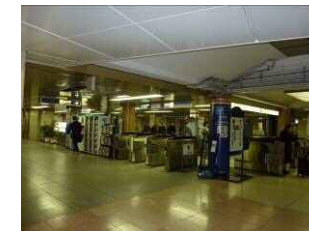
東京メトロ銀座線 改札口付近