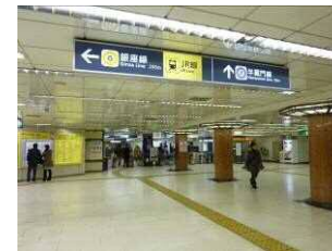
東京メトロ半蔵門線 改札口付近