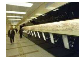
江戸時代の絵巻物 「熙代勝覧」の再現展示 きだいしょうらん