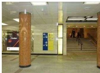
三越本店本館A3出入口