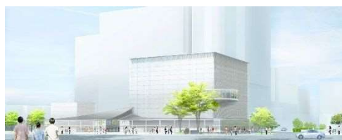
静岡市歴史博物館建設事業（完成イメージ図） （現在工事中。令和5年1月開館予定）

■今回のパブリックコメントでは、平成28年度～令和3年度にかけて実施した、駿府ふれあい地区（第3期）の計画年度が完了することから、実施結果について市民の皆様からご意見をいただくものです。