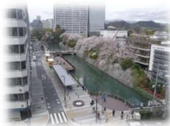
お堀の水辺デッキ整備 （駿府ホリノテラス）