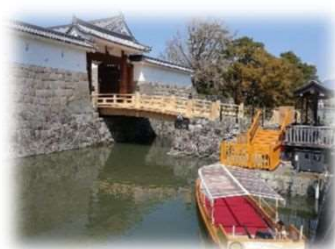
東御門橋の架け替え 葵舟の運行