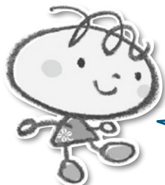
ごみ減量啓発キャラクター しずもちゃん

資源物の出し方や分別については、 「ごみの出し方・分別ガイドブック 保存版」を ご覧ください。