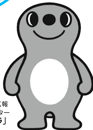
清水区広報 キャラクター 「シズラ」

資源物の出し方や分別については、 「ごみの出し方・分別ガイドブック 保存版」を ご覧ください。