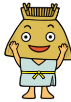
駿河区応援隊長 「トロベエ」