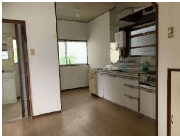
1階ダイニングキッチン