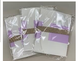
飲食店で食べきれなかった 食事を持ち帰るドギーバッグ