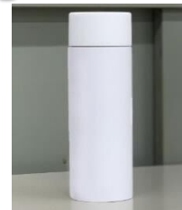
持ち運び便利な ミニボトル