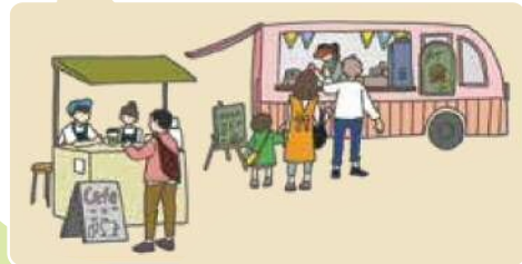
屋外でゆっくり食事を