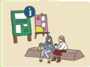
ひと休みのついでに 新たな発見を