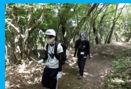
ペースを守って、歩幅はせまく など できるかな？