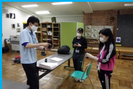
安全に登山をするための知識を身につけました。