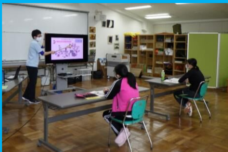
炊飯活動では、どんなリスクが考えられるかな？