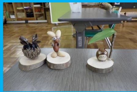
どんぐりなどの木の実を使ってネイチャークラフト！