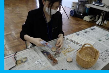
クラフトのリスクの確認とマネジメントを実践！