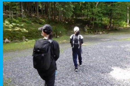
山歩き注意点意識してウォークラリーに出発！