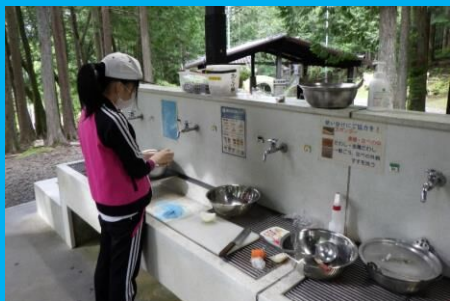
野菜の皮をうすくむいて、ゴミの少ないエコクッキング！