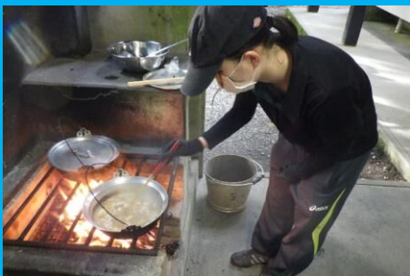
よく燃える薪の組み方を身につけて、火加減ばっちり！