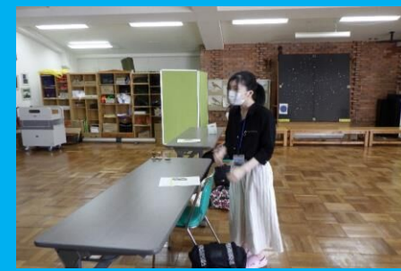
閉講式 2日間でリーダーとしての視点を得ました！