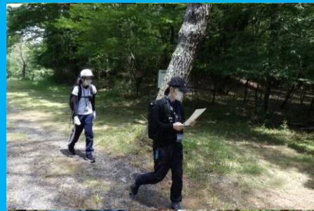
リーダー役と子ども役を入れ替えての実地研修！