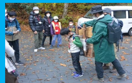
昔の人は、こんな荷物を背負って歩いたの!?