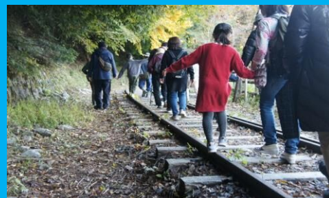
廃線小道 線路の上を歩けるなんて、楽しいな!