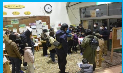
星空散策 井川の満天の星空にびっくり!