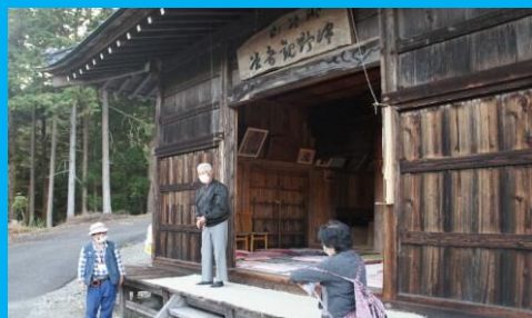
井川の歴史や文化について学んだよ!