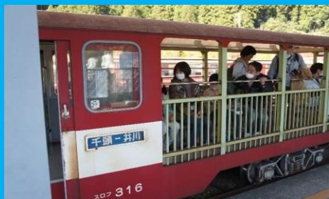
南アルプスアプトラインに乗って、井川へGO!