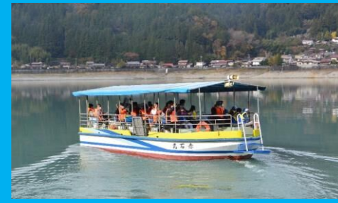
井川湖渡船に乗って、井川本村へ!