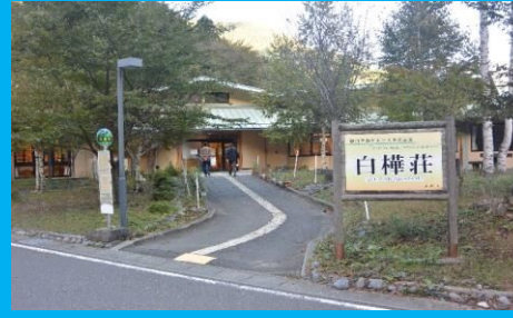
白樺荘で温泉に入り、リフレッシュ!