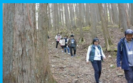
過去に思いをはせながら、大日古道ハイキング!