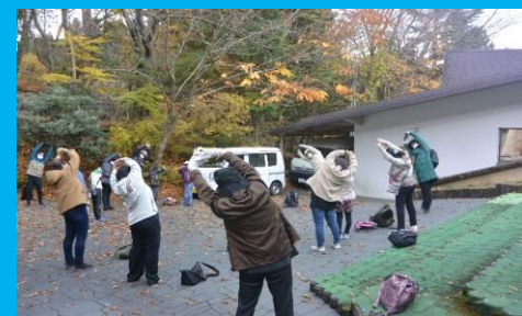
ハイキングの前に、しっかりと準備運動!