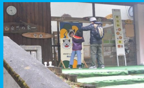
井川自然の家にきた思い出をパシャリ!