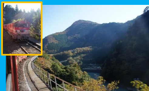
秋のすばらしい景色をたっぷり堪能!