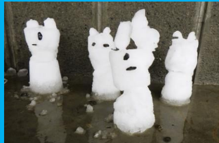
かわいらしい雪の動物がいっぱい!