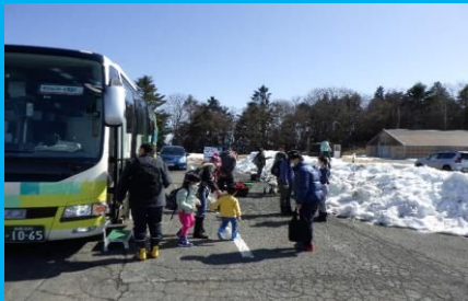
送迎バスでリバウェル井川スキー場に到着!