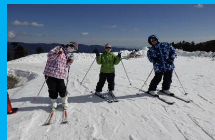
家族でスキー場を満喫しました!