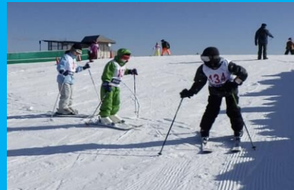
上手に滑れるようになってきたよ!