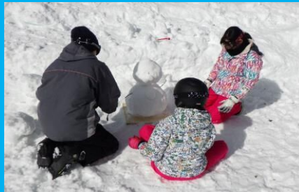
家族で雪だるまを作ったよ!