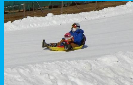
親子でそり遊び! 気持ちがいいな!