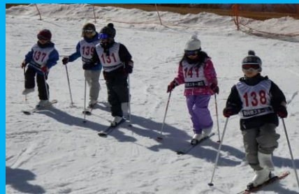
スキー教室 一人で滑れるようにがんばるぞ!