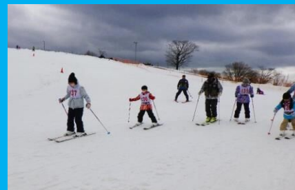
すべる時は「ハの字」が大事!