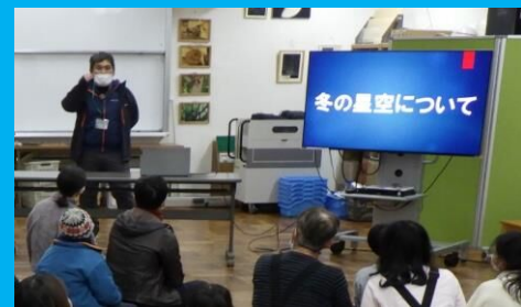
夜には冬の星空について、所員がレクチャー!