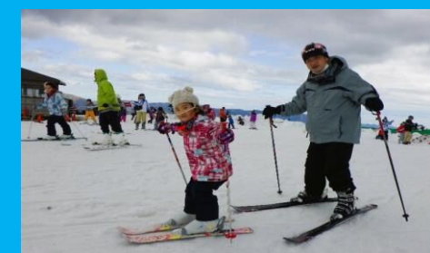
楽しいスキーでにっこり笑顔!