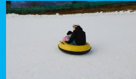
速くてスリル満点なスノーチューブ!