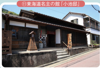
⑪東海道名主の館「小池邸」

由比駅から薩埵峠の登り口までの倉沢寺尾地区は旧家が多く、くぐり戸、格子づくりなどの重厚な構えから江戸時代の面影が忍ばれます。