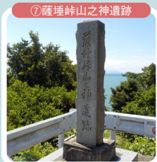
⑦薩埵峠山之神遺跡