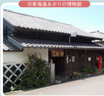
⑩東海道あかりの博物館

富士山と駿河湾の絶景が広がる展望台。写真を撮るならココ! 展望台から見た景色がこちら→