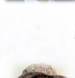
長津恒輝 静岡大学非常勤講師 スポーツ・健康博士