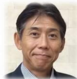
杉山康司 静岡大学グローバル共創科学部 教授