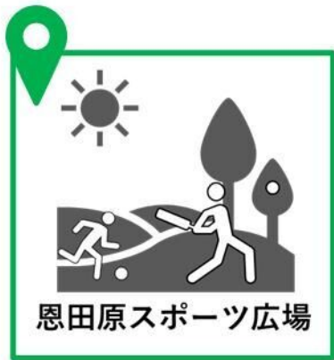
恩田原スポーツ広場