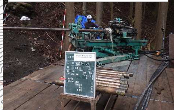
源頭部①工事 削孔状況写真