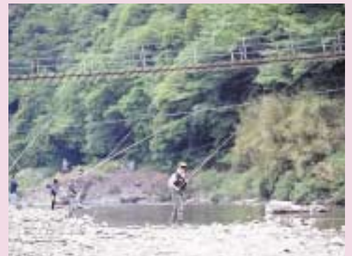
「静岡県のみずべ100選」にも選ばれ、四季を通じて市民に親しまれている興津川。清水地区の90%は、この興津川の表流水を水源としています。