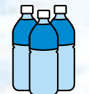
1リットルペットボトル3本分