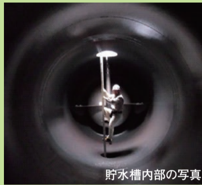
貯水槽内部の写真

そのほかにも… 72時間(3日間)分の電気を発電できる非常用の発電装置を備えているよ!