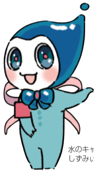
水のキャラクター しずみい