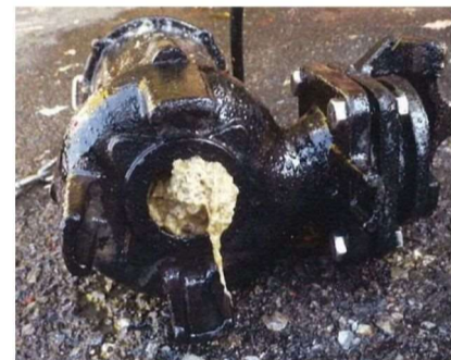
布が詰まり、汚水をくみ上げられない状態のポンプ