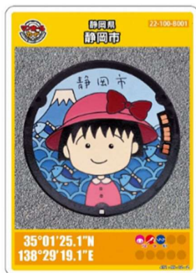
配布するカードデザイン

下水道のPR団体である下水道広報プラットフォーム（GKP）が企画・監修している「マンホールカード」に「ちびまる子ちゃん」が仲間入りしました！