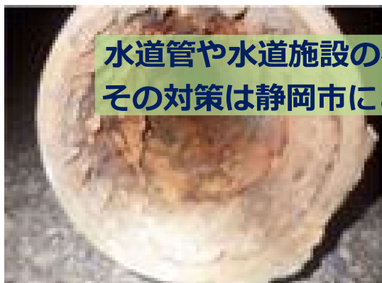
▲老朽化した水道管の内部