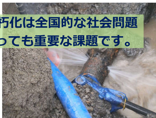
▲老朽化した水道管から漏水

水道管や水道施設の老朽化は全国的な社会問題 その対策は静岡市にとっても重要な課題です。