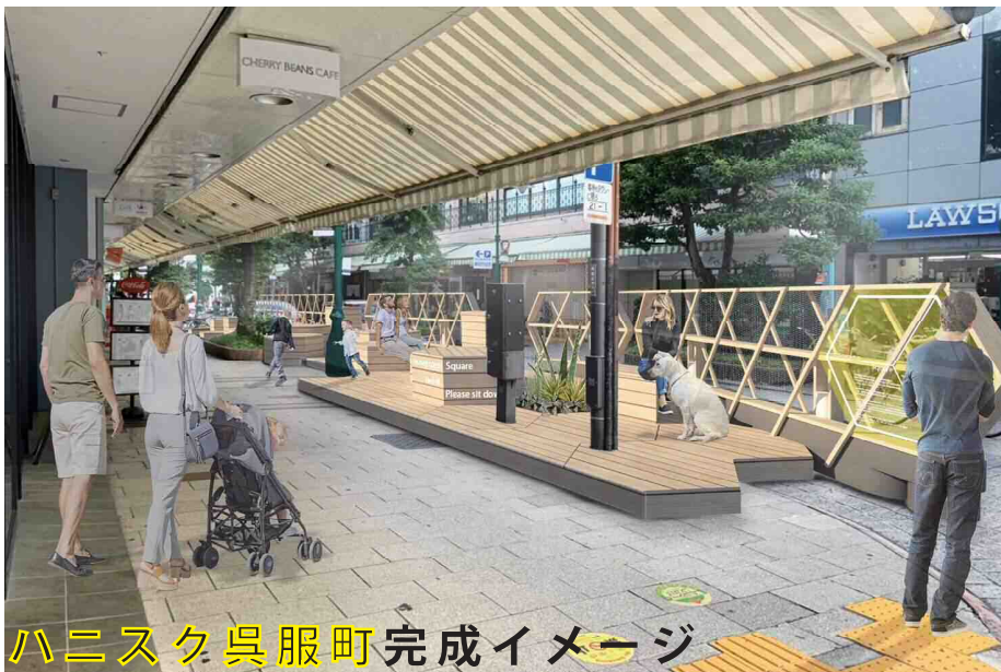
ハニカムスクエア呉服町完成イメージ