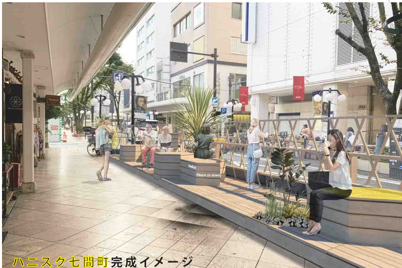
ハニスク七間町完成イメージ