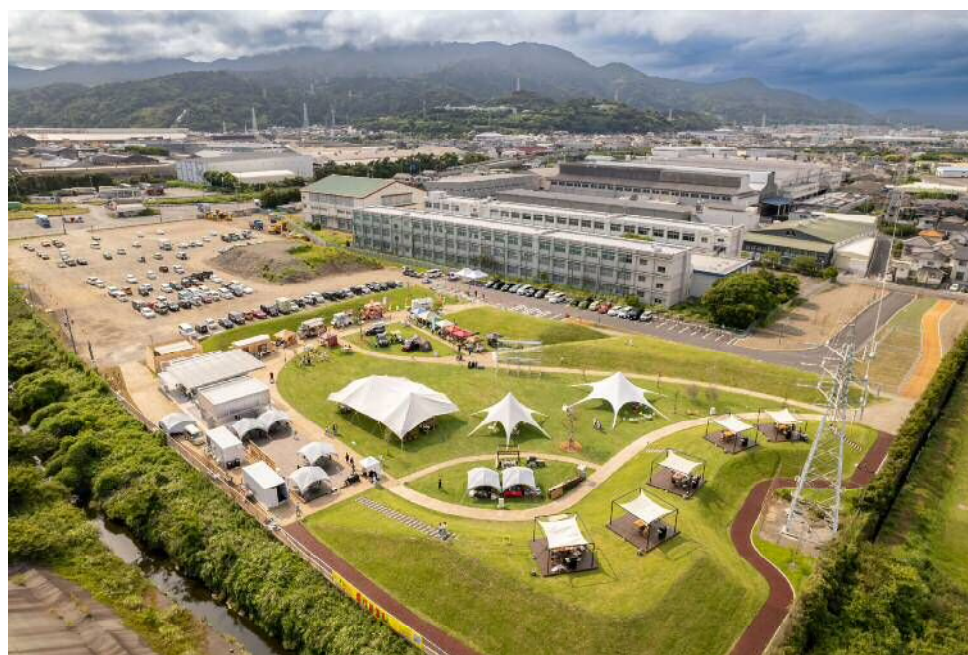
(写真) 令和4年7月2日オープニングセレモニー キッチンカーやマルシェが並び市内外から多くの方が訪れ盛大にオープンしました。

「企業×企業、企業×地域、企業×行政」という様々な化学反応を起こして、新たな価値を生み出すこの実験場を静岡市と一緒に作りませんか？