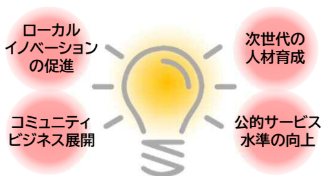
(図1) 実験場では、思いもよらない連携が生まれるかも…