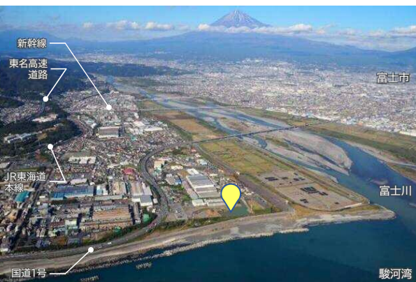
(写真) 整備予定地は富士山の眺望が抜群な富士川右岸に位置する。静岡市だけでなく中部連携中枢都市圏の5市2町の玄関口でもある。