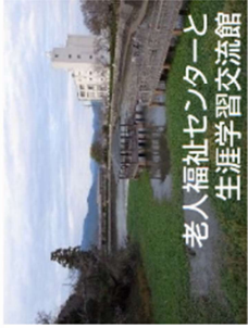
老人福祉センターと生涯学習交流館