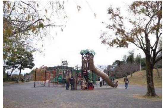
トリム広場の複合遊具（令和2年度リニューアル）