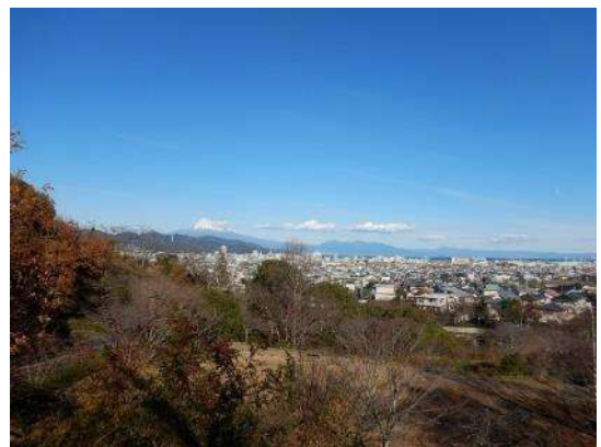
中央広場から富士山を望む