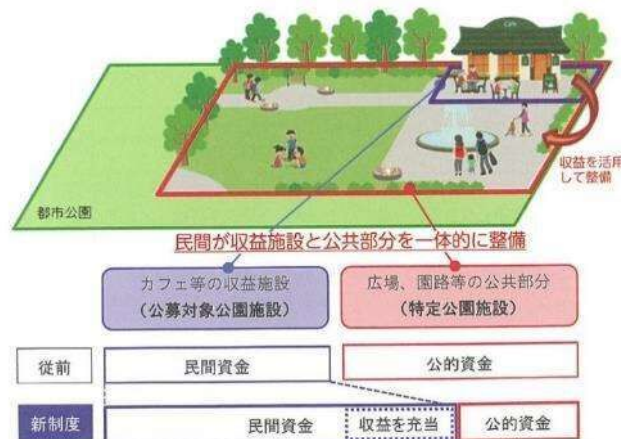
公募設置管理制度の整備イメージ図

・都市公園において飲食店、売店等の公園利用者の利便性の向上に資する公園施設（公募対象公園施設）の設置と、その設置した施設から得られる収益を活用して、その周辺の園路、広場等の公園施設整備や、改修等を一体的に行う民間事業者を公募により選定する制度です。