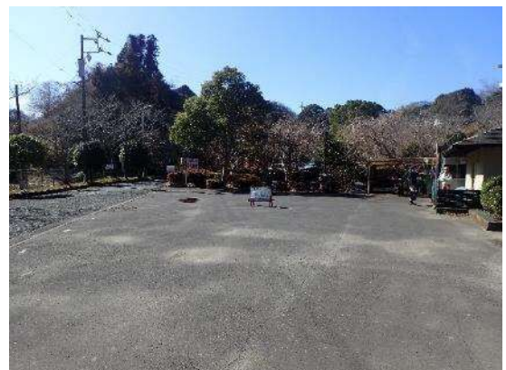
イベント広場横（元バス転回場）