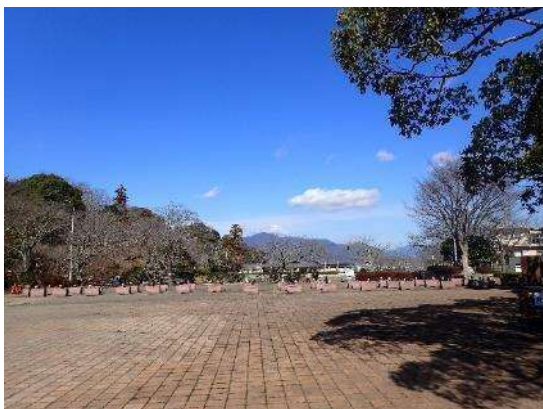
イベント広場（管理棟前）