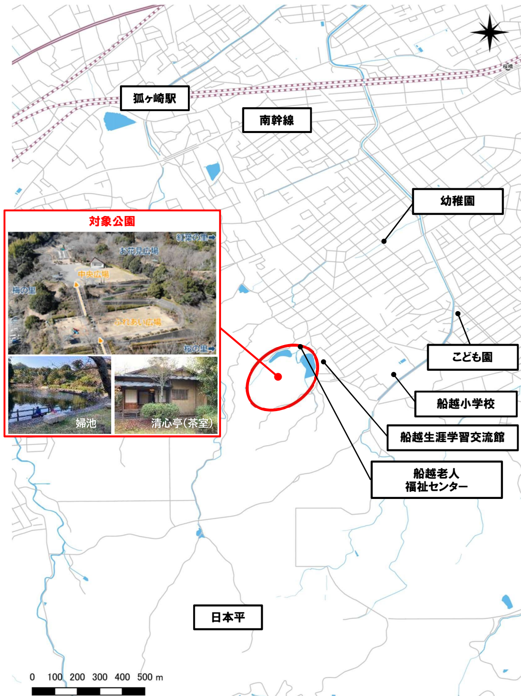
清水船越堤公園周辺位置図

本事業の対象公園は、静岡鉄道狐ヶ崎駅から南に約1.5km、幹線道路である南幹線から1km程度の日本平麓の東側に位置する総合公園です。公園周辺は宅地利用が広がっており、公園内には、複合遊具や天文台等の施設や堤の回りの桜木は毎年花見シーズンになると市民で賑わいます。又、子供たちの遠足などにも多く利用される大規模な公園です。