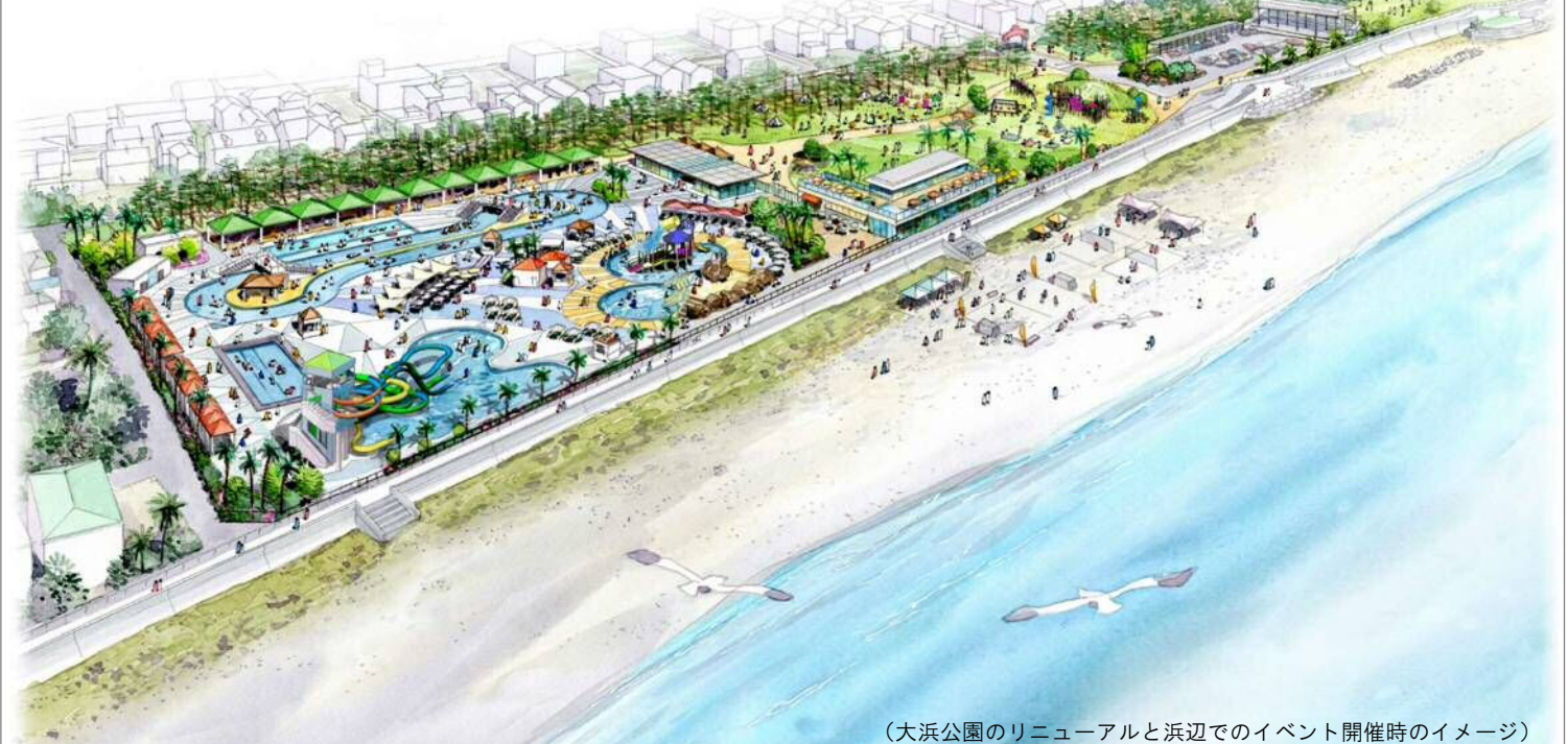
(大浜公園のリニューアルと浜辺でのイベント開催時のイメージ)

公園全体のリニューアルにより、駿河湾と富士山を望む海辺の豊かな環境を活かして新たな地域の賑わいを創出する拠点づくりを目指します。