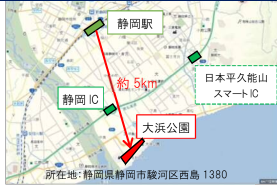
所在地：静岡県静岡市駿河区西島1380 図1) 大浜公園へのアクセス

大浜公園プールは、大浜海水浴場の代替施設として昭和5年に開園した歴史ある公共施設で、無料※で利用できる人気施設として広く市民に愛されてきました。