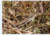
ショウリョウバッタ