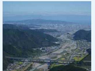
山頂から見た藁科川と市街地