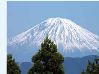
山頂から見た富士山

山頂は整備され、植樹もされています。トイレも整備され、ツツジなどの四季の花樹が楽しめます。また草の広場もあり、ワラビがよく生えています。