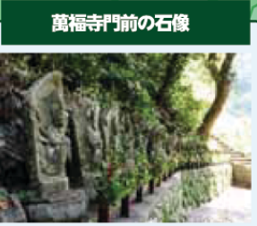
萬福寺門前の石像