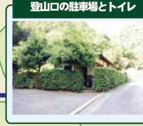
登山口の駐車場とトイレ