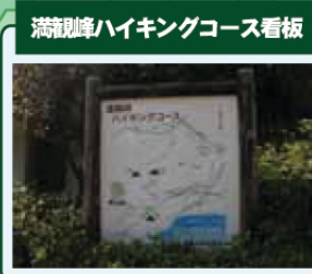
満観峰ハイキングコース看板