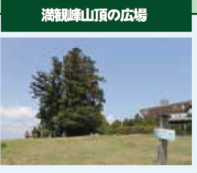
満観峰山頂の広場