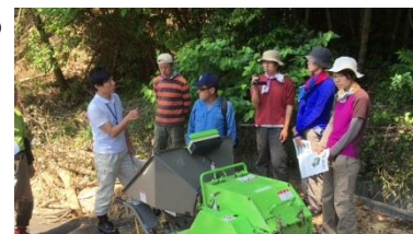
竹破碎機講習会の様子

詳しくは、静岡市役所 環境創造課 自然ふれあい係 (☎054-221-1319) までご連絡ください。