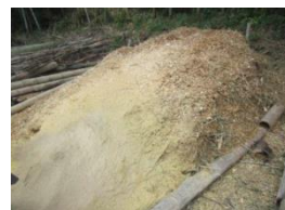
できあがった竹チップ