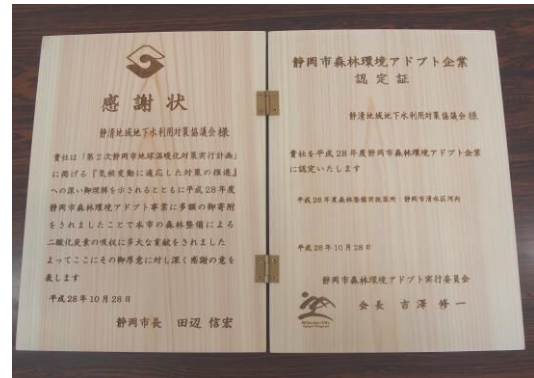
森林環境アドプト企業認定証及び感謝状