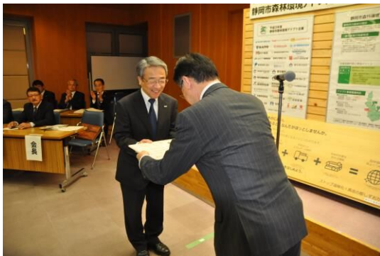
森林環境アドプト企業認定証授与