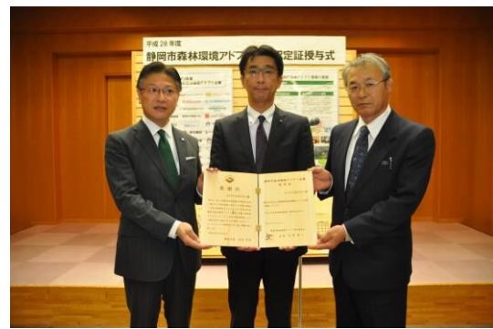
静岡市長と記念撮影