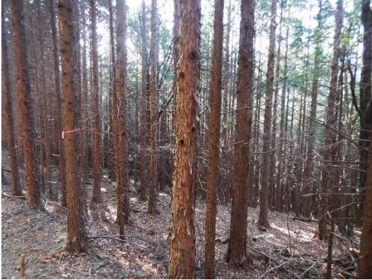
【森林整備前の様子】

令和2年度は、葵区井川の長尾地区及び上坂本の だしやま 出山地区において、森林整備を合計9.24ha実施しました。これまでに整備した面積は、3か年で合計34.11haとなり、平成23年から令和2年の10年間で、合計107.45haの整備が完了しました。