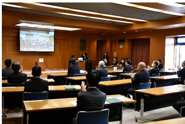
積み木贈呈式の様子

積み木贈呈式は、新型コロナウイルス感染症対策のため、授与式の会場と静岡精華幼稚園をオンラインで中継しながら開催しました。会場では、静岡市環境局長から園児に積み木が贈呈される様子が映され、その後、市長からこども達へ向けて挨拶がありました。