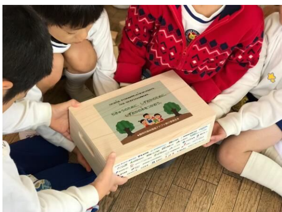
こども園への寄贈の様子

*木育…木材との関わりを深めることで、木についての理解を深めるだけでなく、鋭い感性や自然への親しみ、森林や環境問題に対する理解の基礎を育むこと。