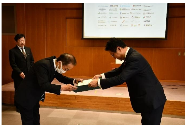
感謝状・認定証の授与の様子

授与式では、静岡市森林環境アドプト実行委員会会長から本事業へご協力いただいた企業・団体等の皆様に「静岡市森林環境アドプト企業認定証」を授与するとともに、静岡市長からは感謝状を贈呈しました。