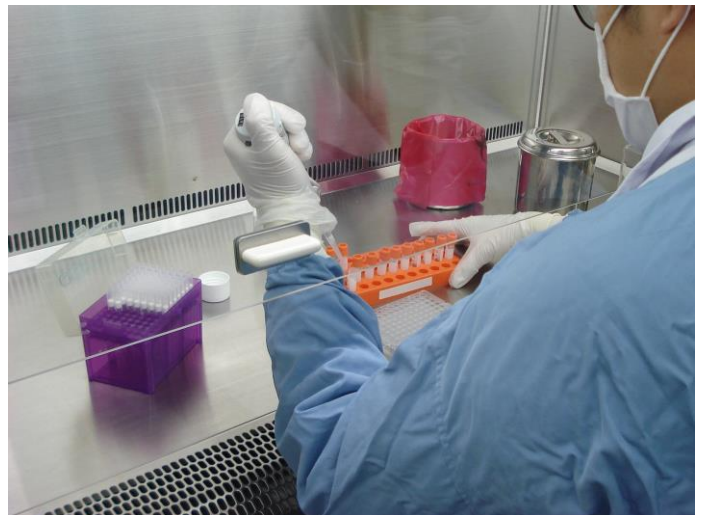
検査風景（環境保健研究所）

https://www.city.shizuoka.lg.jp/s9437/s003390.html