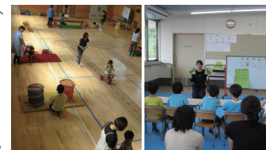
<サーキットトレーニング> <グループ活動>

清水区駒越西 2-10-10 静岡市しみず社会福祉事業団内 TEL: 335-1148